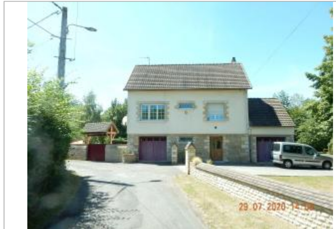
2 rue Réage Saint Benoit

Coordonnées WGS84 : X: -0.01772620 / Y: 48.73707600