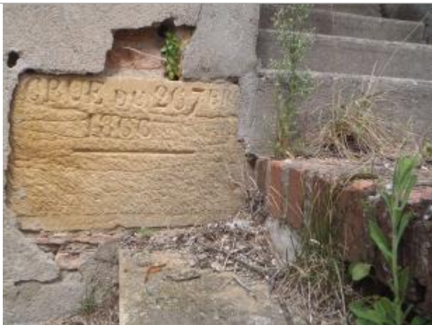
Photo du repère en 2017