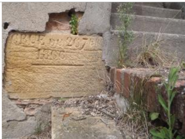
Photo du repère en 2017