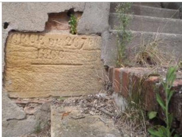
Photo du repère en 2017