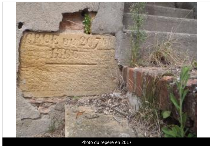
Photo du repère en 2017

Texte : Crue du 26 7bre 1866 Maximum de l'inondation : Oui Visibilité : Non État du repère : Moyen Pérennité : Moyenne Repère calculé : Non PHEC : Non renseigné