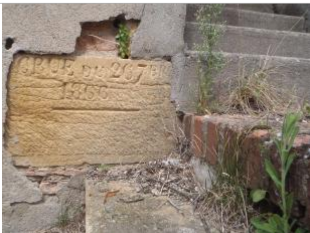
Photo du repère en 2017