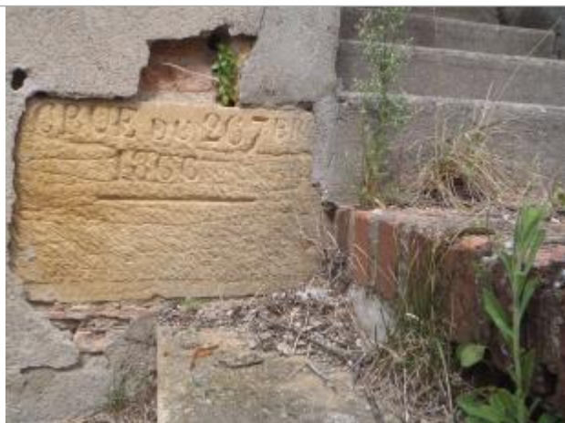
Photo du repère en 2017