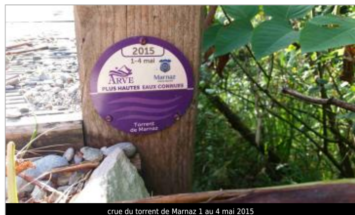
crue du torrent de Marnaz 1 au 4 mai 2015