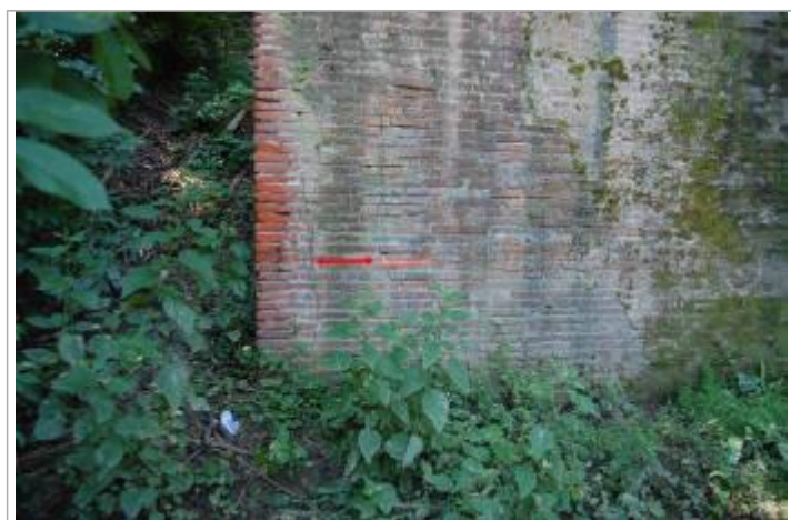
Vue du repère - Géosphair

Altitude calculée de l'eau (en m) : 97.87 m