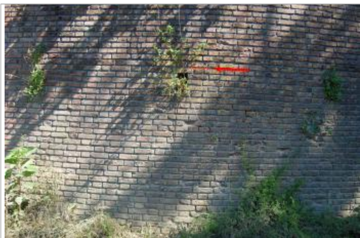
Vue du repère - Géosphair

Altitude calculée de l'eau (en m) : 142.71 m