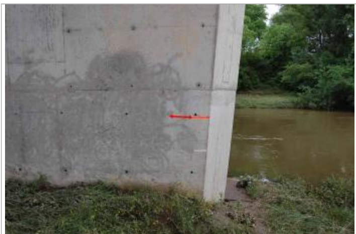
Vue du repère - Géosphair