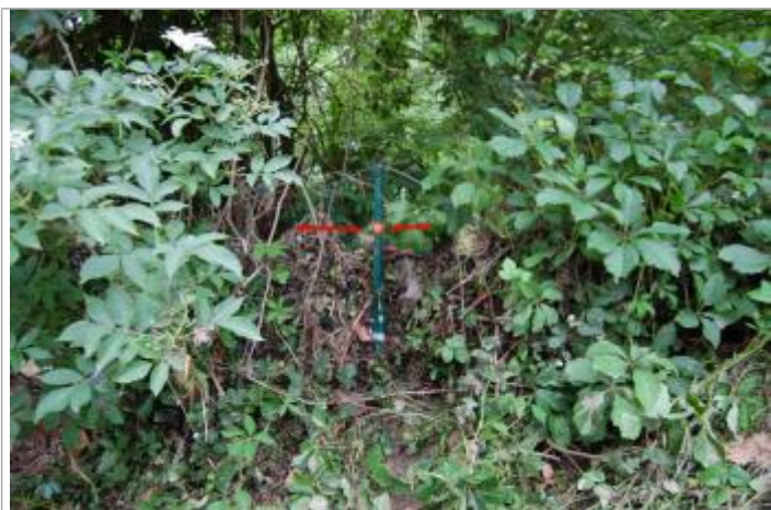
Vue du repère - Géosphair

Altitude calculée de l'eau (en m) : 166.56 m