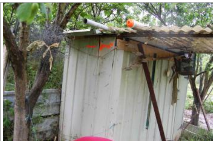
Vue du repère - Géosphair

Altitude calculée de l'eau (en m) : 169.47 m