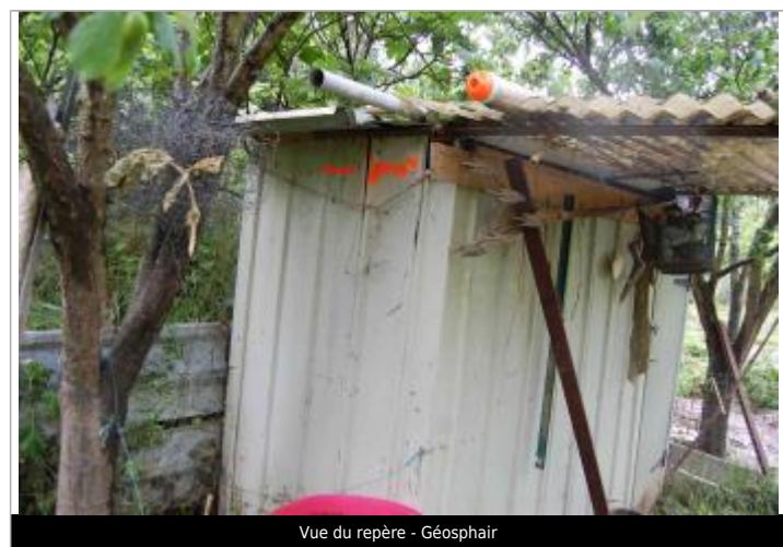
Vue du repère - Géosphair