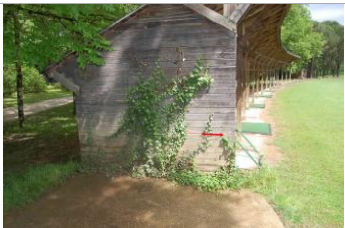
Vue du repère - Géosphair

Altitude calculée de l'eau (en m) : 169.69 m