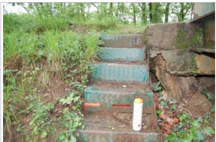
Vue du repère - Géosphair