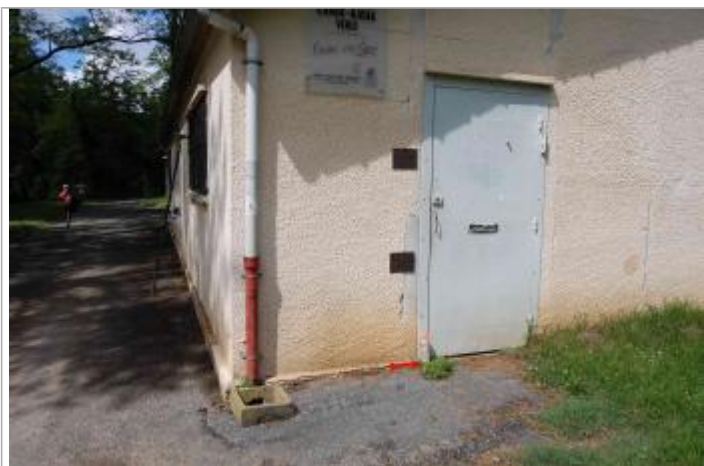
Vue du repère - Géosphair

Altitude calculée de l'eau (en m) : 173.41 m