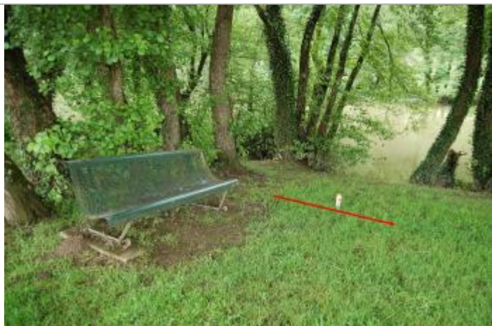
Vue du repère - Géosphair

Altitude calculée de l'eau (en m) : 214.63 m