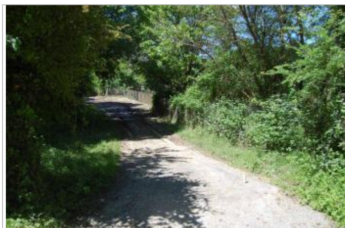
Vue du site - Photo © GEOSPHAIR

GÉOLOCALISATION Coordonnées WGS84 : X: 1.77562005 / Y: 43.74431230 Coordonnées RGF93 (Lambert 93) X: 601360.54 / Y: 6294685.7 Coordonnées RGF93 (ETRS89) : X: 1.7756201 / Y: 43.7443123 Code Hydro: O4--0250 Rive de référence: Gauche