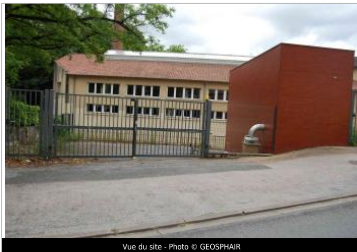
Vue du site - Photo © GEOSPHAIR