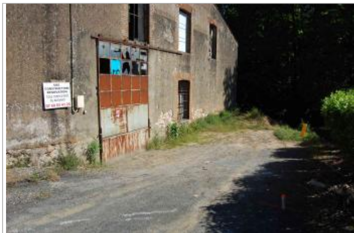
Vue du site - Photo © GEOSPHAIR