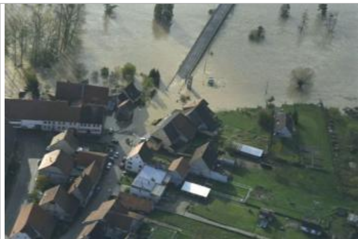
Service Navigation Strasbourg

GÉOLOCALISATION Coordonnées WGS84 : X: 7.06901108 / Y: 48.90133820 Coordonnées RGF93 (Lambert 93) : X: 998170.21 / Y: 6874499.25 Coordonnées RGF93 (ETRS89) : X: 7.0690111 / Y: 48.9013382 Code Hydro: A9--0100 Rive de référence: Non renseigné