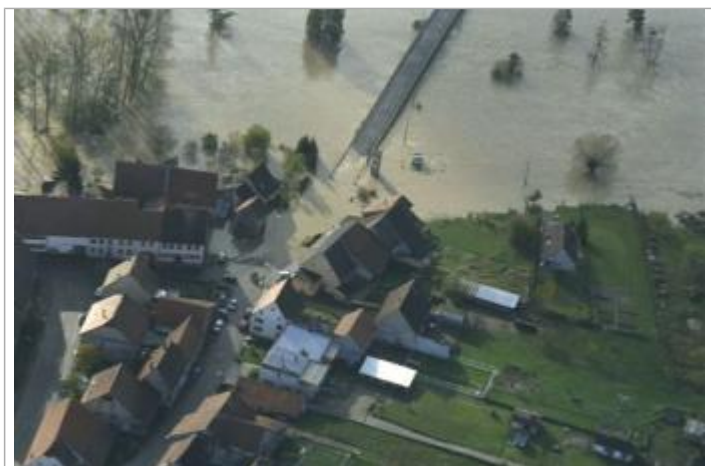
Service Navigation Strasbourg

GÉNÉRAL Code : RS_R_119_1 Date de mise à jour : 24/09/2021 Auteur : SPC RS