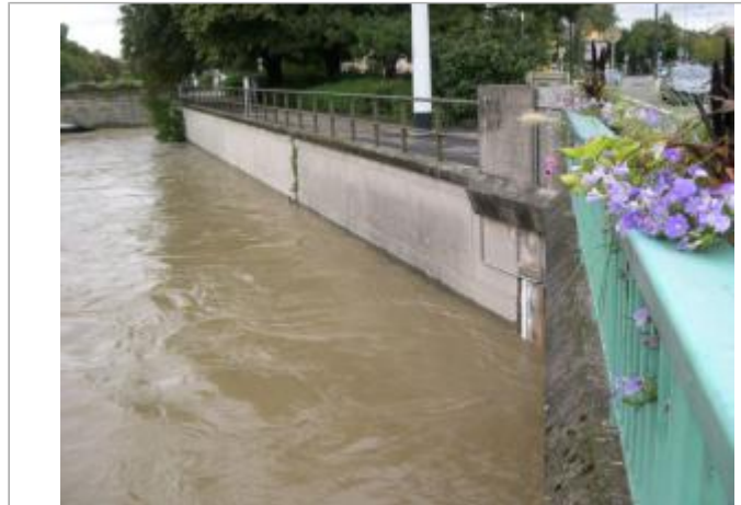
DREAL-GE/Ville Mulhouse M2A