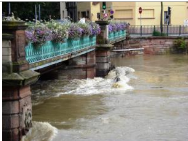
DREAL-GE/Ville Mulhouse M2A