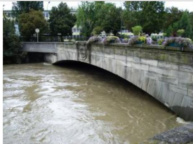
DREAL-GE/Ville Mulhouse M2A