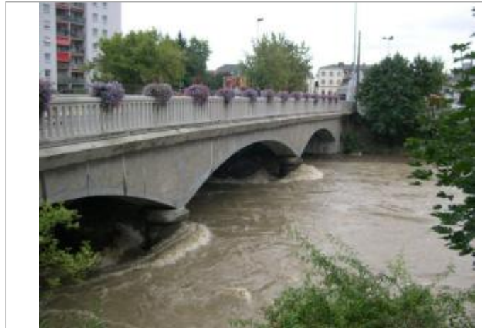
DREAL-GE/Ville Mulhouse M2A