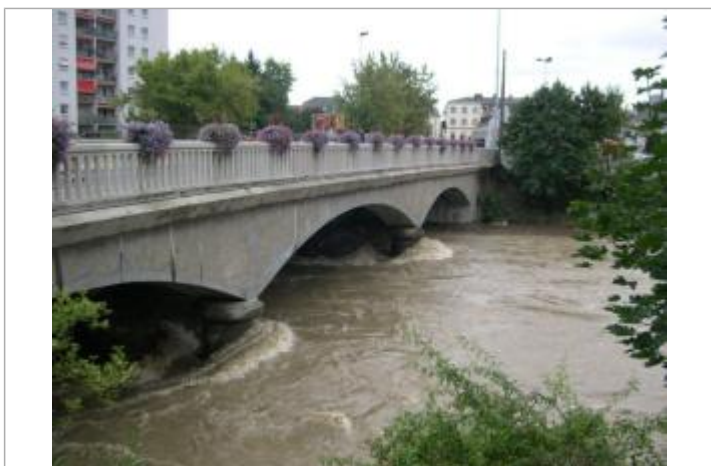
DREAL-GE/Ville Mulhouse M2A