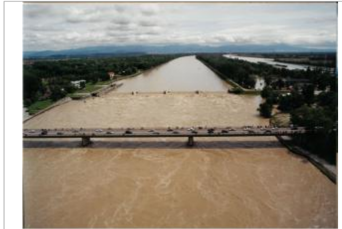
Service Navigation Strasbourg