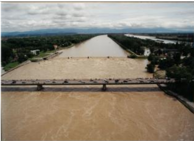
Service Navigation Strasbourg