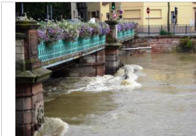
DREAL-GE/Ville Mulhouse M2A