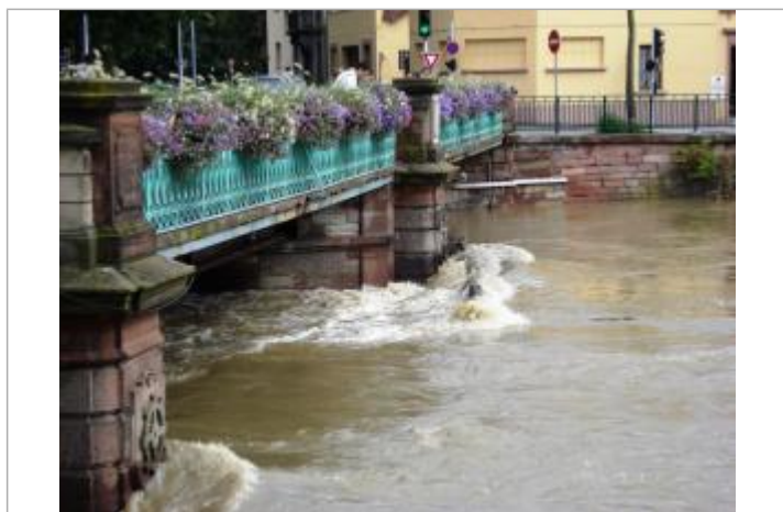
DREAL-GE/Ville Mulhouse M2A