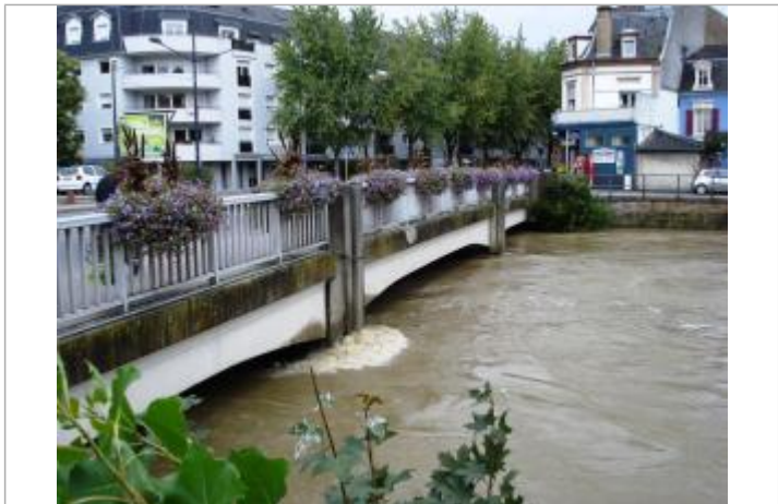
DREAL-GE/Ville Mulhouse M2A

GÉNÉRAL Code : RS_R_45_1 Date de mise à jour : 27/08/2020 Auteur : SPC RS