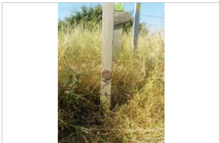
Implantation sur poteau panneau indicateur piste cyclable