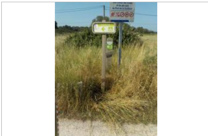
Piste cyclable, les Dunes du Port