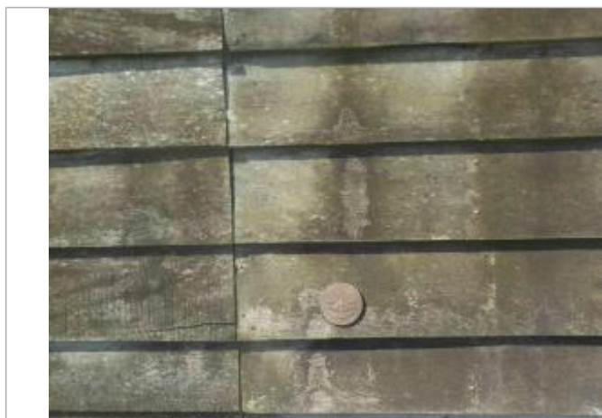
Implantation sur Salorge