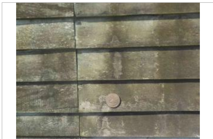
Implantation sur Salorge