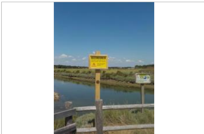
Piste cyclable de Cul d'Âne