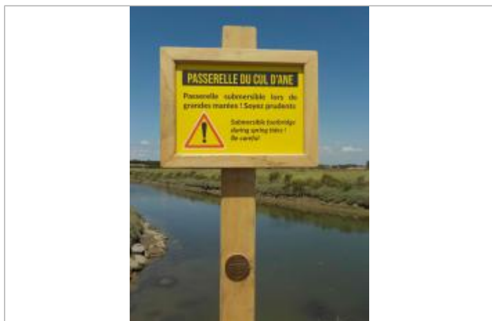
Implantation sur poteau bois sous pancarte information passerelle submersible