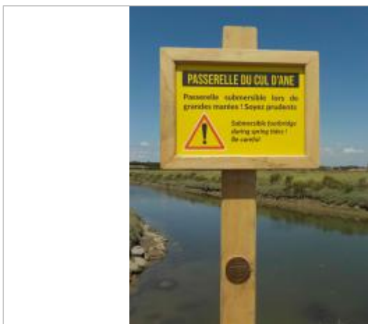
Implantation sur poteau bois sous pancarte information passerelle submersible