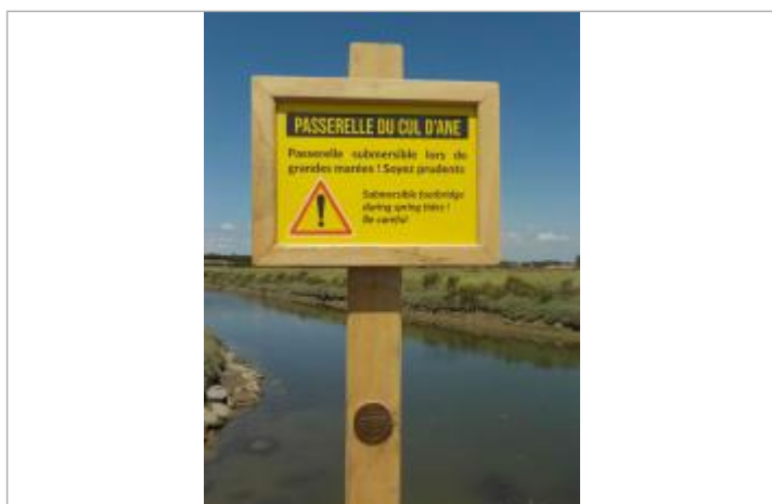
Implantation sur poteau bois sous pancarte information passerelle submersible

Texte : 2010 Xynthia Maximum de l'inondation : Oui Visibilité : Oui