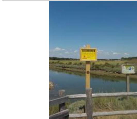
Piste cyclable de Cul d'Âne