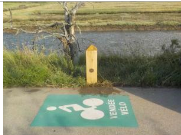
Piste cyclable, route du Veillon, à proximité du chateau du Veillon