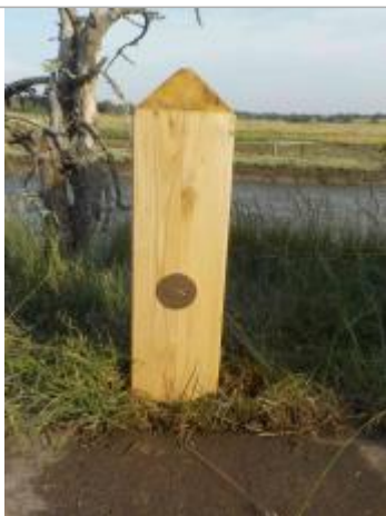
Implantation du repère sur une borne en bois au bord de l'apiste cyclable sur la route du Veillon