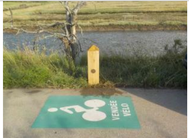
Piste cyclable, route du Veillon, à proximité du château du Veillon