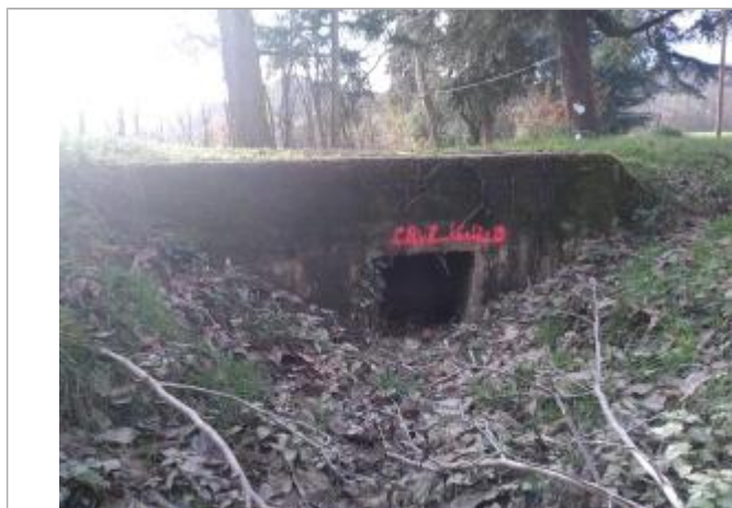
vue de la hauteur atteinte par refoulement dans le fossé traversant la route - face entrée Landourra-Neuf