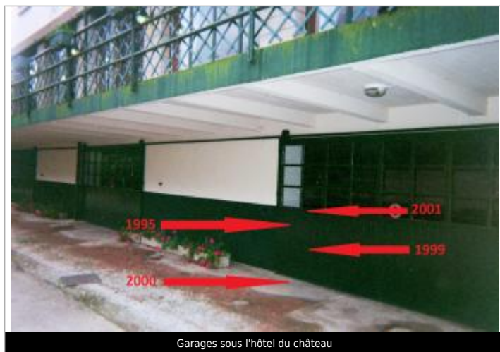
Garages sous l'hôtel du château

Altitude calculée de l'eau (en m) : 32.48 m