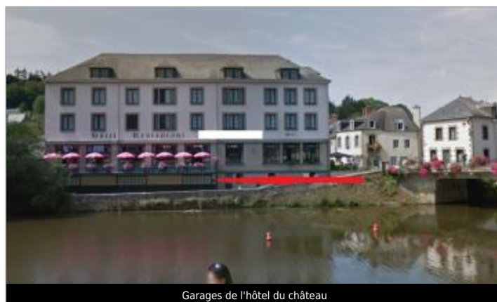
Garages de l'hôtel du château

GÉOLOCALISATION Coordonnées WGS84 : X: -2.54856940 / Y: 47.95207780 Coordonnées RGF93 (Lambert 93) X: 286156.55 / Y: 6775844.61 Coordonnées RGF93 (ETRS89) : X: -2.5485694 / Y: 47.9520778 Code Hydro: J8--0230 Rive de référence: Droite