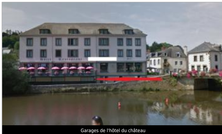
Garages de l'hôtel du château