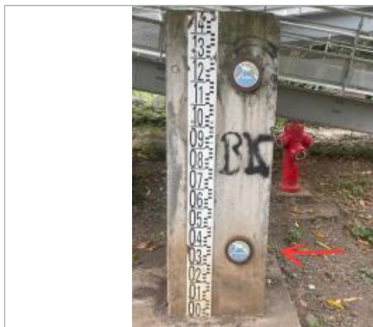
Plot béton avec échelle limnimétrique et repères de crue, DEAL Réunion, 2023