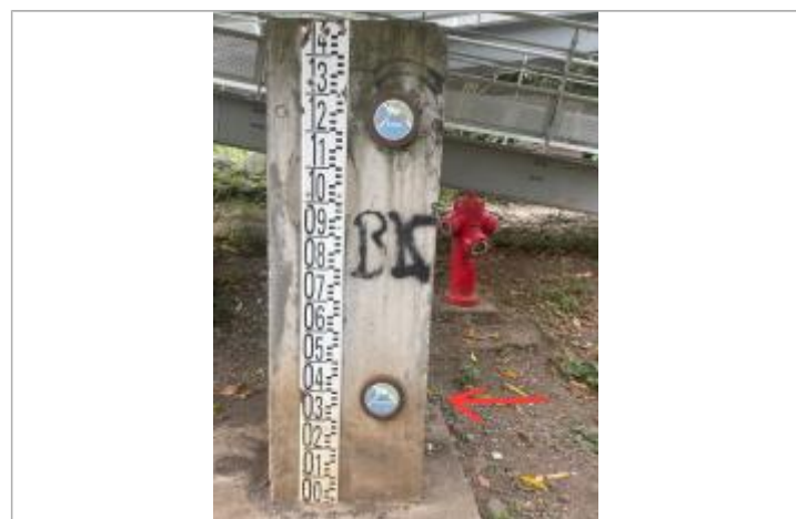
Plot béton avec échelle limnimétrique et repères de crue, DEAL Réunion, 2023

GÉNÉRAL Code : WEB_R_202008112336 Date de mise à jour : 15/09/2023 Auteur : Xavier PIERRE