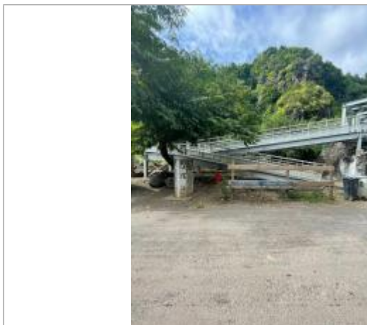
Vue générale du site, DEAL Réunion, 2023

Coordonnées WGS84 : X: 55.43994400 / Y: -20.89378800