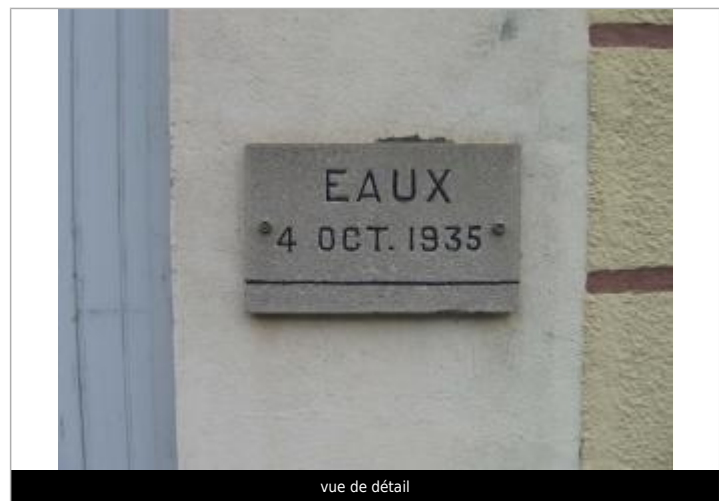
vue de détail