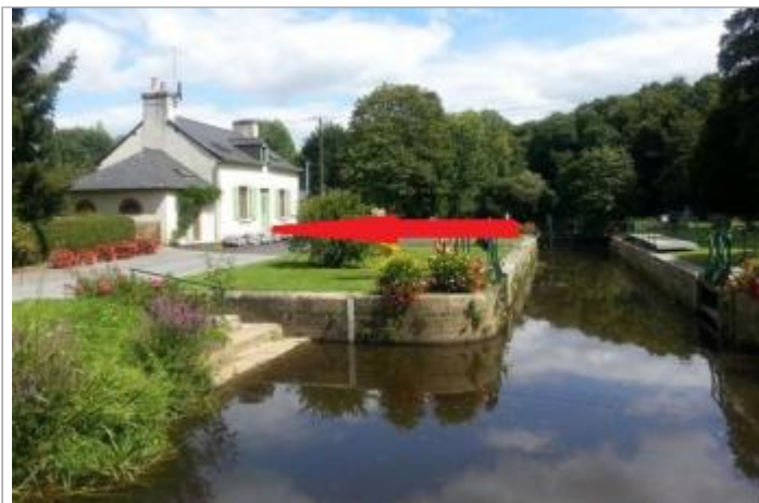
Ecluse de beaufort à Josselin