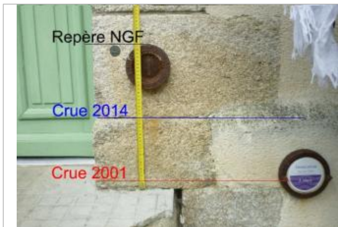
Comparaison niveaux des crues de 2001 et 2004 sous le repère de nivellement IGN

Altitude calculée de l'eau (en m) : 33.901