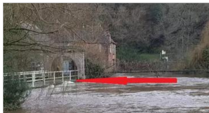
Pont allant de la maison éclusière au moulin de Beaufort - photo Ouest-France 16 janvier 2020

GÉNÉRAL Code : Josselin_OJ10 Date de mise à jour : 11/08/2020 Auteur : SPC VCB