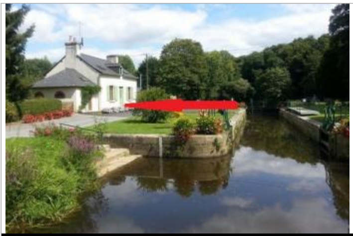
Ecluse de beaufort à Josselin

GÉOLOCALISATION Coordonnées WGS84 : X: -2.55773030 / Y: 47.95187400 Coordonnées RGF93 (Lambert 93) : X: 285472.82 / Y: 6775870.07 Coordonnées RGF93 (ETRS89) : X: -2.5577303 / Y: 47.951874 Code Hydro: J8--0230 Rive de référence: Droite