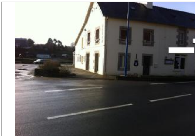
Vue d'ensemble de la devanture du bâtiment