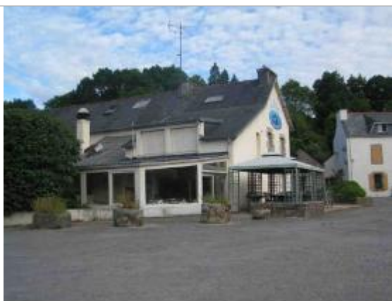
180 cm d'eau dans la véranda en 2000.