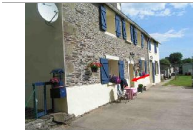
55 cm d'eau sur le plancher.

Altitude calculée de l'eau (en m) : 38 m