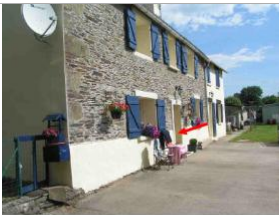
55 cm d'eau sur le plancher.

Altitude calculée de l'eau (en m) : 38 m