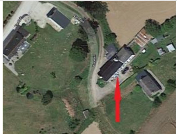
Photographie aérienne des maisons au lieu-dit Keralain