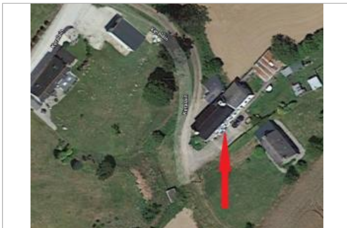
Photographie aérienne des maisons au lieu-dit Keralain