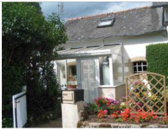
120 cm dans la maison la plus en aval (avec véranda).

Altitude calculée de l'eau (en m) : 38.32