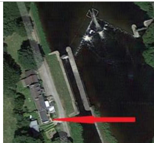
Photographie aérienne des maisons au niveau de l'écluse de Kerbaoret