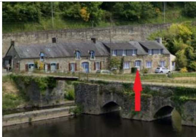
Maisons quai Jean Guivarc'h à Chateaufneuf du Faou