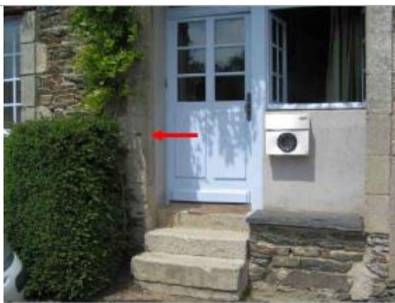
Repère de crue fixé sur le montant gauche de la porte d'entrée.

Altitude calculée de l'eau (en m) : 42.18