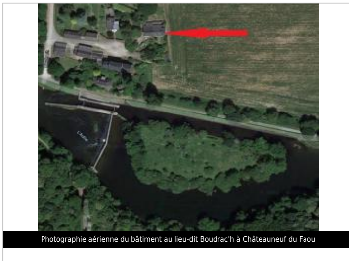
Photographie aérienne du bâtiment au lieu-dit Boudrac'h à Châteauneuf du Faou