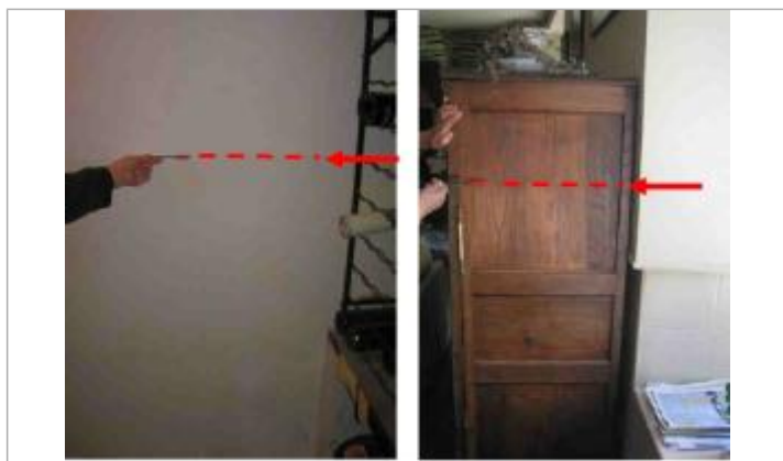
Traces visibles dans la cave et sur le meuble du mur de façade.