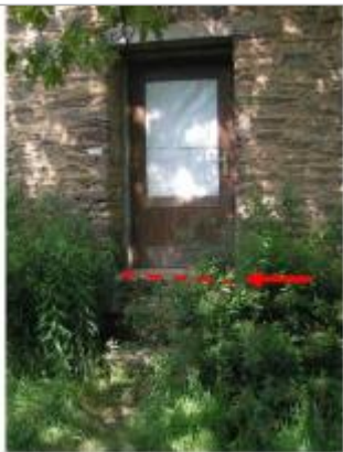
L'eau a atteint le nez de la dernière marche de la partie amont du bâtiment (partie inhabitée).

Altitude calculée de l'eau (en m) : 44.49 m