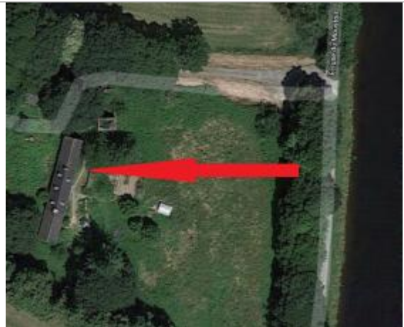
Photographie aérienne de la longère au lieu-dit Kérisid à Châteaufneuf du Faou