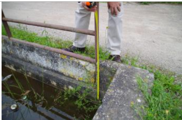
Laisse de crue sur rebord en ciment du pont

Altitude calculée de l'eau (en m) : 154.534