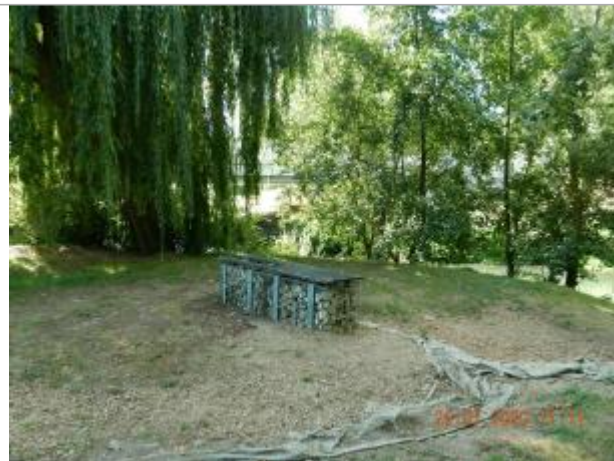
Gabion dans le parc face à la base de canoés