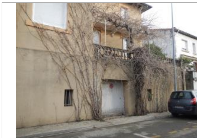
Laisse de crue au niveau de la moitié de la hauteur du gabion

NIVELLEMENT SPC SACN. LE SPC N'EST PAS GÉOMÈTRE EXPERT, LES COTES SONT DONNÉES À TITRE INDICATIF.