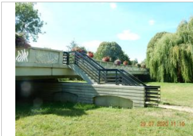
Escalier dans le parc face à la base de canoés