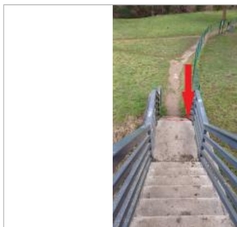
laisse de crue sur la 10 ème marche.

Altitude calculée de l'eau (en m) : 154.2