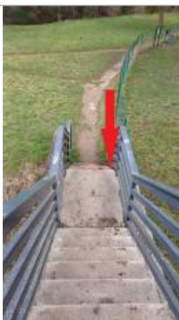
laisse de crue sur la 10 ème marche.

Altitude calculée de l'eau (en m) : 154.2