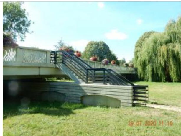
Escalier dans le parc face à la base de canoés