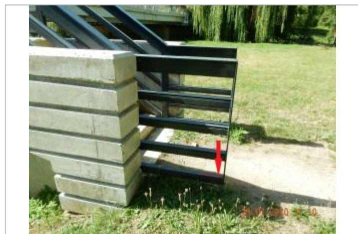
Laisse de crue au niveau de la 5 ème latte de la garde au corps en partant de la rampe