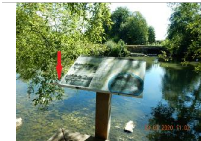
Laisse de crue sur la partie supérieur du pupitre

NIVELLEMENT SPC SACN. LE SPC N'EST PAS GÉOMÈTRE EXPERT, LES COTES SONT DONNÉES À TITRE INDICATIF.