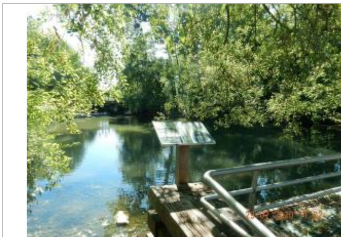
Pupitre dans le parc face à la minoterie