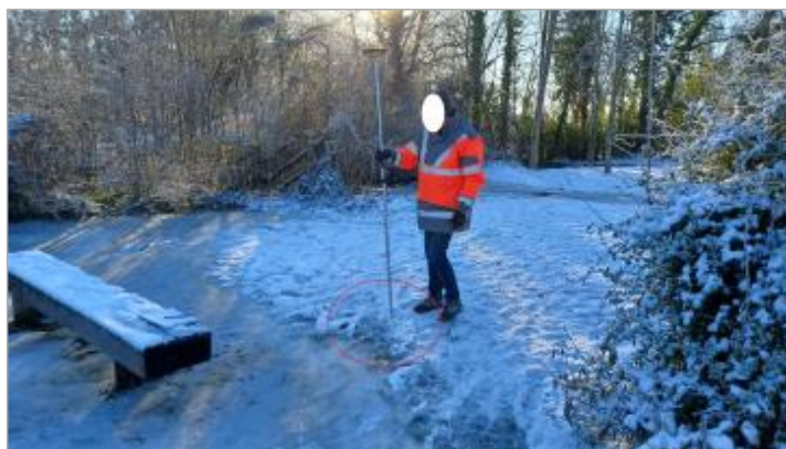
Laisse de crue à proximité du banc reporté sur ce dernier.