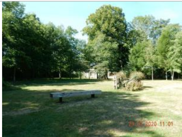
Parc face à la Minoterie