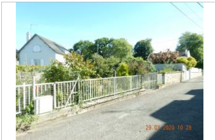
Impasse du croissant