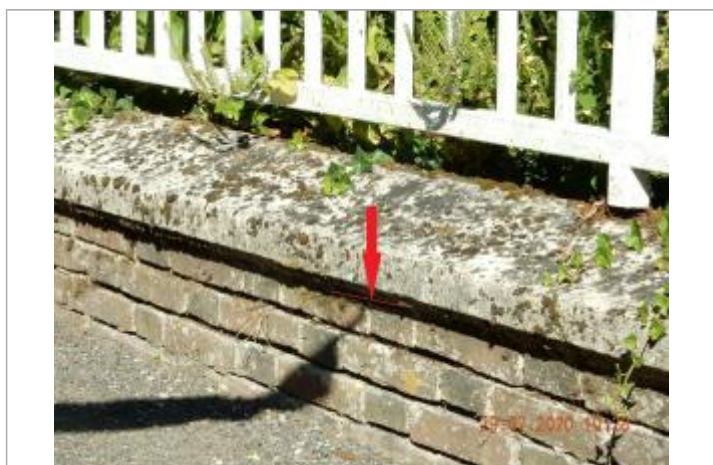
Laisse de crue sous dalle de ciment

NIVELLEMENT SPC SACN. LE SPC N'EST PAS GÉOMÈTRE EXPERT, LES COTES SONT DONNÉES À TITRE INDICATIF.