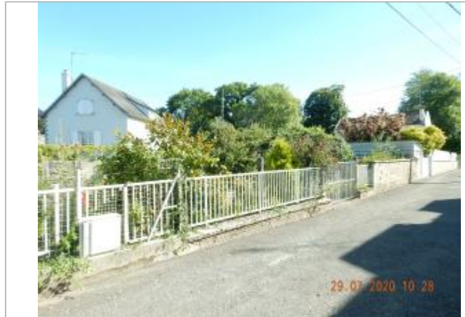
Impasse du croissant