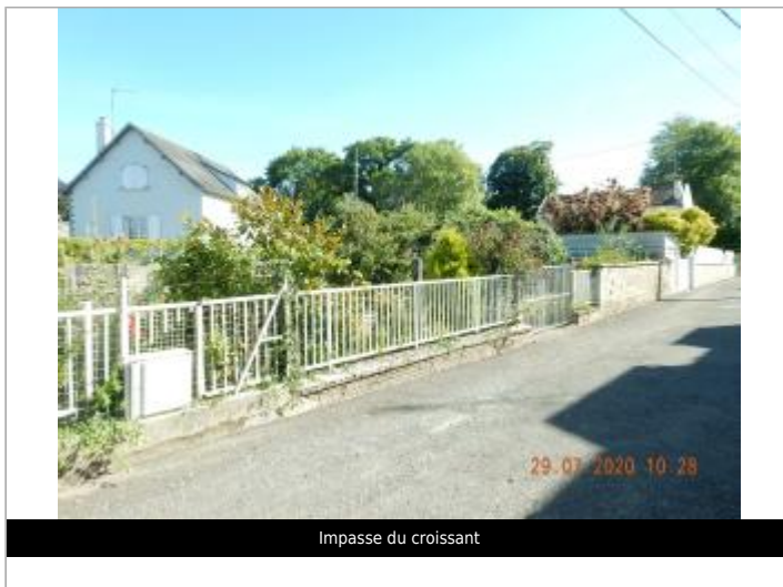
Impasse du croissant