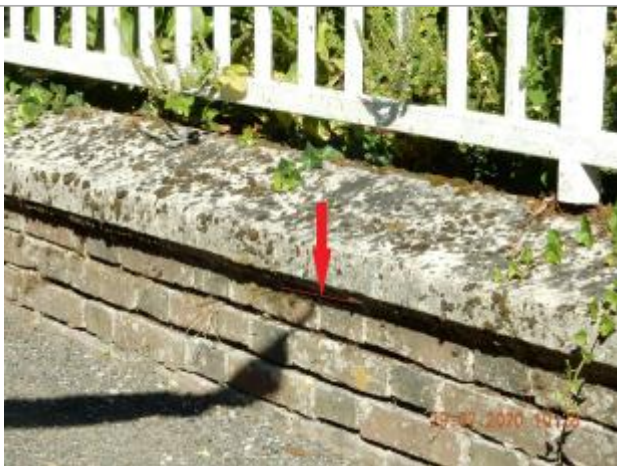
Laisse de crue sous dalle de ciment

Altitude calculée de l'eau (en m) : 154.84