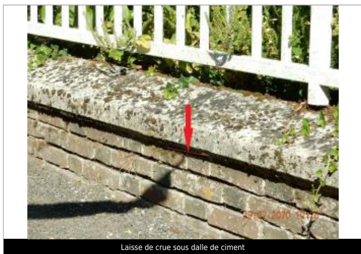
Laisse de crue sous dalle de ciment

NIVELLEMENT SPC SACN. LE SPC N'EST PAS GÉOMÈTRE EXPERT, LES COTES SONT DONNÉES À TITRE INDICATIF.