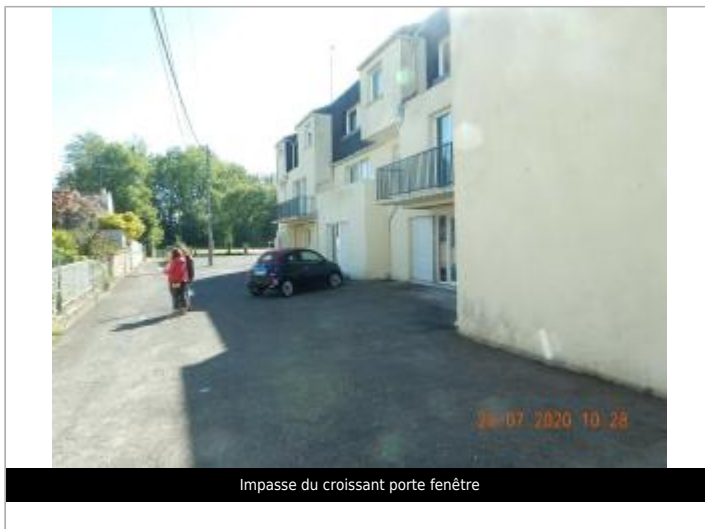
Impasse du croissant porte fenêtre