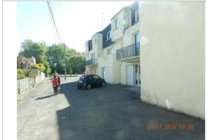
Impasse du croissant porte fenêtre

Coordonnées WGS84 : X: -0.02312430 / Y: 48.73892280