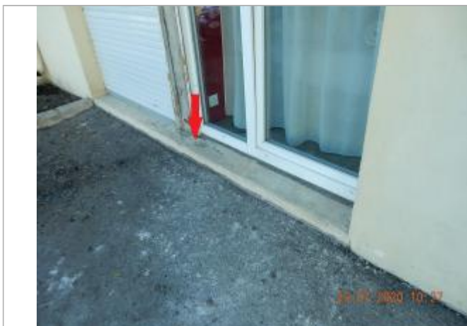
Laisse de crue sur margelle devant porte fenêtre

NIVELLEMENT SPC SACN. LE SPC N'EST PAS GÉOMÈTRE EXPERT, LES COTES SONT DONNÉES À TITRE INDICATIF.