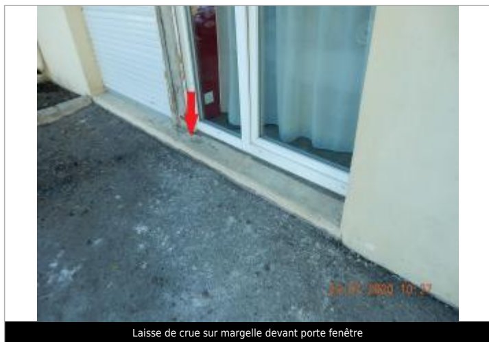
Laisse de crue sur margelle devant porte fenêtre

NIVELLEMENT SPC SACN. LE SPC N'EST PAS GÉOMÈTRE EXPERT, LES COTES SONT DONNÉES À TITRE INDICATIF.